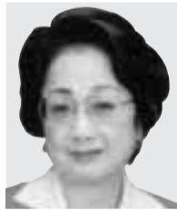
国土交通大臣 扇 千景 おおぎ ちかげ 首都機能移転担当 保守党 参議院・比例区 67歳