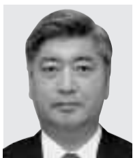
国務大臣 中谷 元 なかたに げん 防衛庁長官 衆議院・高知二区 自民党 43歳