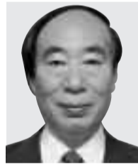
厚生労働大臣 坂口 力 さかくち ちから 公明党 衆議院・比例(東海) 67歳