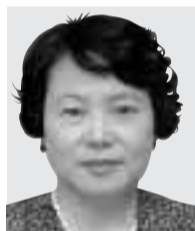
文部科学大臣 遠山 敦子 とやま あつこ 国立国会図書館連絡 調整委員会委員 元国立美術館理事長 62歳