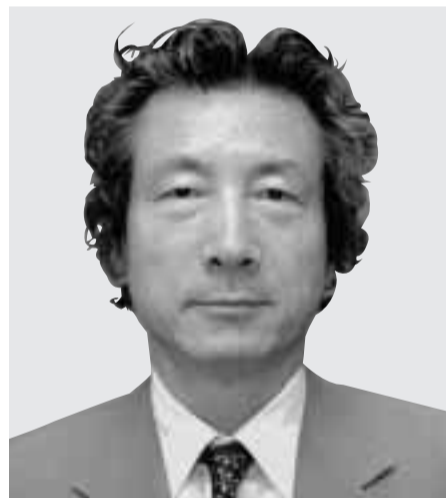
内閣総理大臣 小泉 純一郎 こいずみ じゅんいちろう 衆議院・神奈川県十一区 自民党 59歳

日本経済の立て直しに向け、緊急経済対策の速やかな実施と 新たな産業・雇用を創出するための取り組みを推進