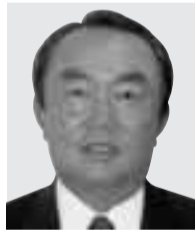
経済産業大臣 平沼 赳夫 ひらぬま たけお 国際博覧会担当 衆議院・岡山三区 自民党 61歳