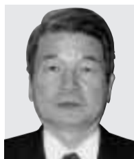
国務大臣 柳澤 伯夫 やなぎさわ ほかお 金融担当大臣 衆議院・静岡三区 自民党 65歳