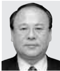
農林水産大臣 武部 勤 たけべ つとむ 衆議院・北海道十二区 自民党 59歳