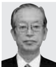
国務大臣 尾身 幸次 おみ こうじ 沖縄及び北方対策担当大臣 科学技術政策担当大臣 衆議院・比例(北関東) 自民党 68歳