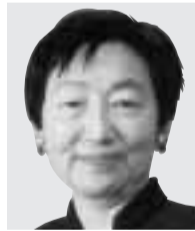
環境大臣 川口 順子 かわくち よりこ 地球環境問題担当 元会社役員 60歳