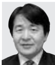
国務大臣 竹中 平蔵 たけなか へいぞう 経済財政政策担当大臣 新千年紀記念行事推進担当 情報通信技術(IT)担当 元大学教授 50歳