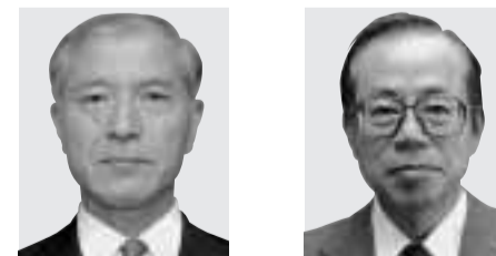
国務大臣 福田 康夫 ふくだ やすお 内閣官房長官 男女共同参画担当大臣 衆議院・群馬四区 自民党 64歳