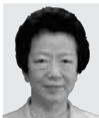
法務大臣 森山 眞弓 もりやま まゆみ 衆議院・比例(北関東) 自民党 73歳