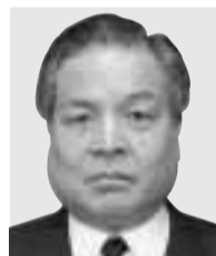
総務大臣 片山虎之助 かたやま とらのすけ 参議院・岡山県選挙区 自民党 65歳