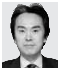
国務大臣 石原 伸晃 いしはら のぶてる 行政改革担当 規制改革担当大臣 衆議院・東京八区 自民党 44歳