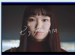
首都圏、関西、中部、北海道においてCMを放映