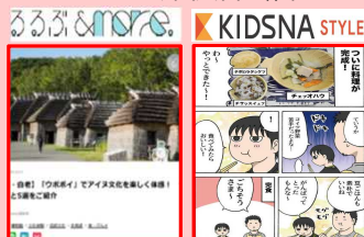
Webメディアで情報発信