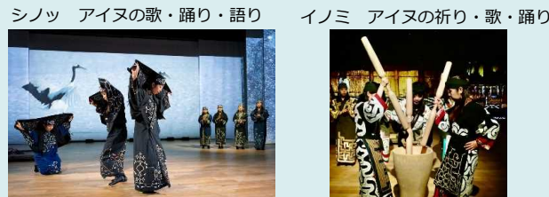
▶ 古式舞踊とデジタル技術による美しい背景を一体化