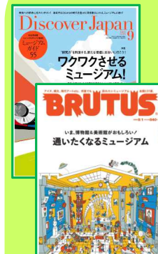
雑誌特集記事掲載