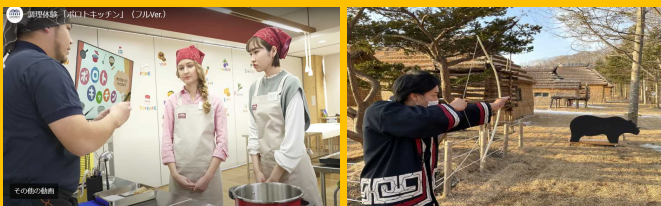
調理体験「ポロトキッチン」 弓矢体験「アクシノツ」