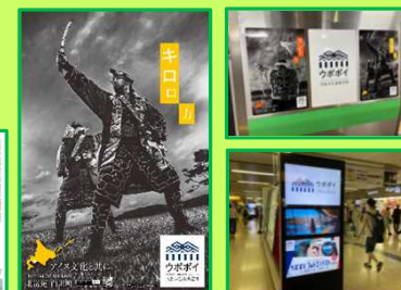
PRポスターの作成・配布 ・JR北海道車体広告 ・札幌駅、新千歳空港にサインージ広告