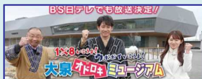
特番の放送 STV「1×8いこうよ！」