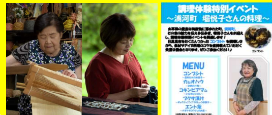
▶ 各地域伝承者を招聘し、伝統技術を実演等