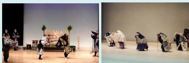
▶ 各地域の保存会による特色ある舞踊等を披露