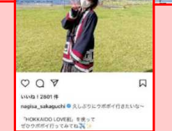
公式SNSやアンバサダーによる情報発信