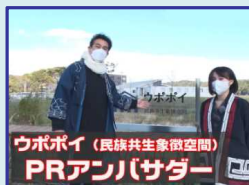
アンバサダーによるウポポイ紹介