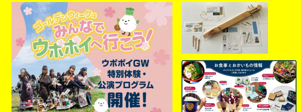
▶ 家族連れやリピーターを誘客するプログラムを実施