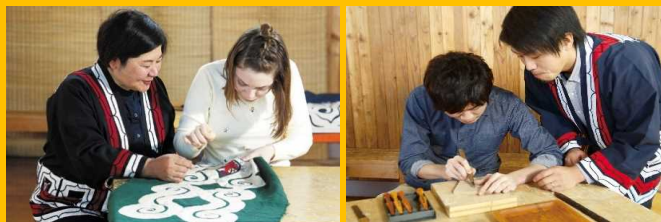
刺繍体験「イカラカラアン」 木彫体験「イヌイエアン」