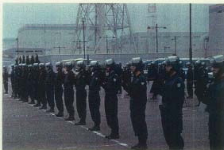
柏崎・刈羽原子力発電所を 警備する銃器対策部隊