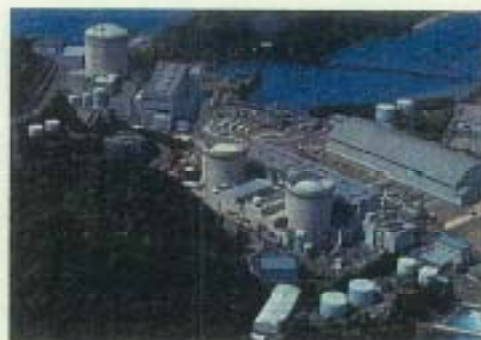
美浜原子力発電所