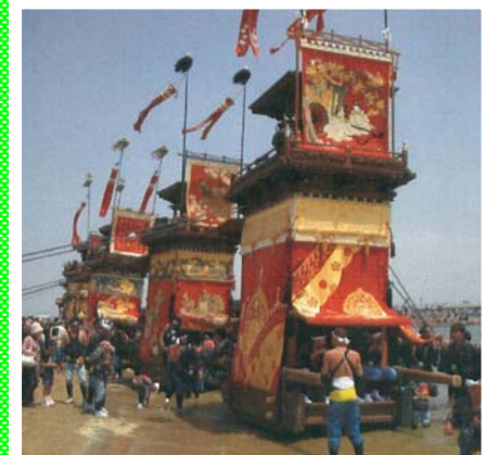
重要無形民俗文化財 『亀崎潮干祭の山車行事』