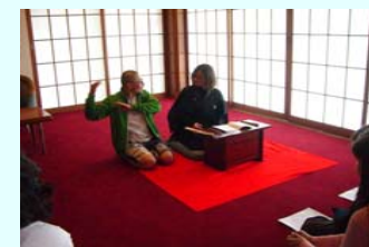
文化庁文化交流使の活動