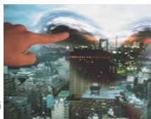
Khronos Projector 作者: Alvaro CASSINELLI