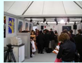
海外映画祭への出展支援等