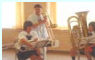
地域人材の活用による文化活動支援