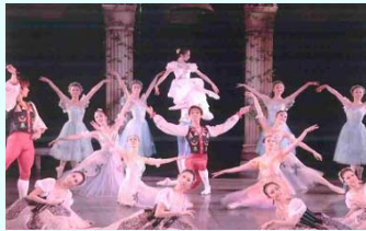
本物の舞台芸術に触れる機会の確保