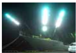
さんま棒受け網漁業における LED技術の導入