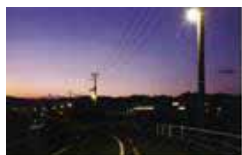
【無電極ランプ】 省エネルギー性が高く 長寿命で、フィラメント や電極がない照明機器