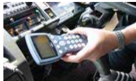
【エコドライブ管理システム機器】

環境にやさしく経済的な次世代内航船舶（スーパーエコシップ【SES】）の普及支援 （国土交通省） （平成20年度：40億円）