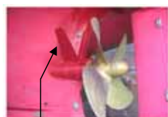
フレンドフィン （プロペラの推進効率向上）