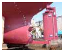
船尾バルブと二重反転プロペラ （推進効率の向上）