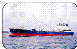
SES貨物船1番船「新衛丸」 船種：貨物船兼油送船 総トン数：492総トン 就航：H19.2.15 主要航路：京浜～伊豆諸島