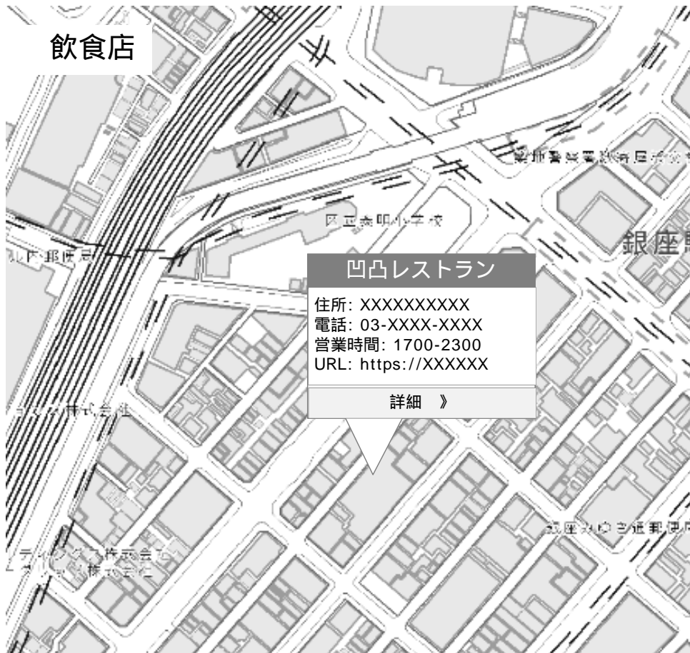
イメージ図は、地理院地図（国土地理院）を使用して作成