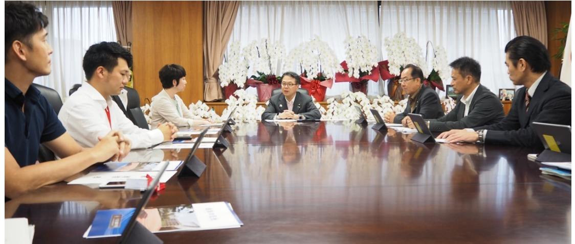
懇談会の様子（2017/9/5@経済産業大臣室）