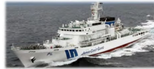
大型巡視船(イメージ)