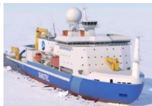
北極域研究船の完成イメージ図