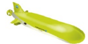
自律型無人探査機(AUV)