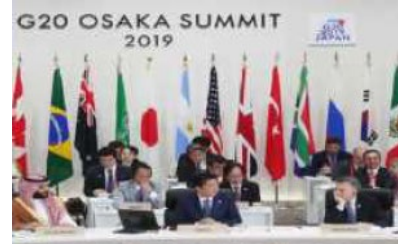
「大阪ブルーオーシャンビジョン」が共有された G20大阪サミット(2019)の様子