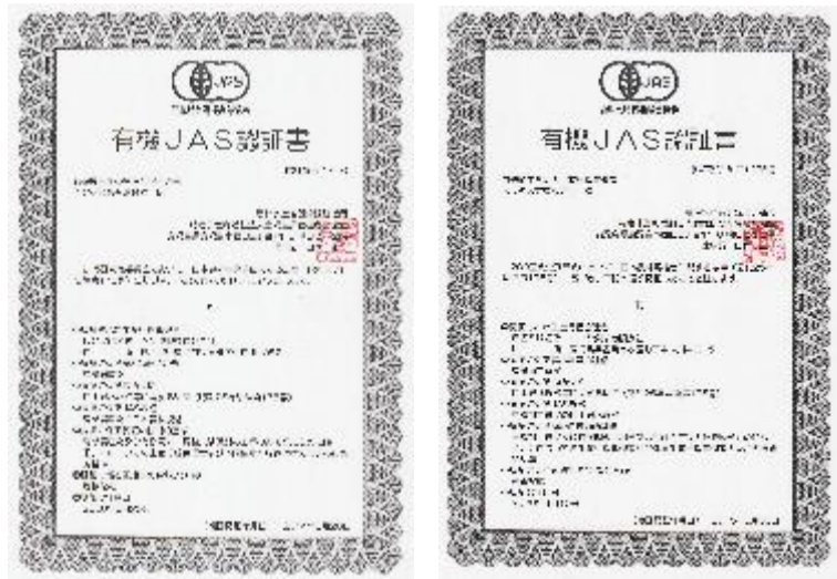
農産物と加工食品の有機JAS認証を取得