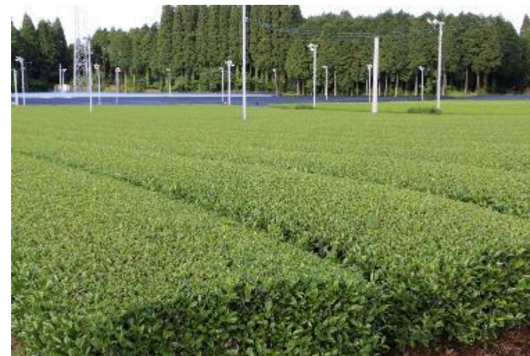
農薬飛散を受けないため新たに開墾したヘンタ茶園の茶畑