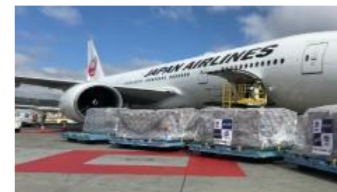
チャーター便にて米国に有機抹茶を輸出