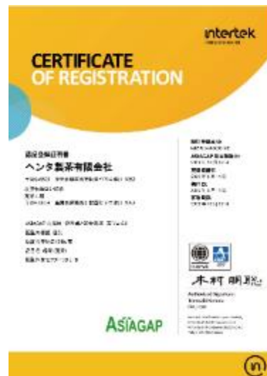
2018年10月にASIA-GAP認証を取得