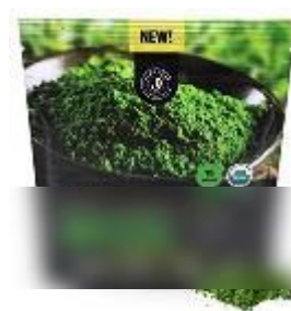
米国で販売する抹茶商品