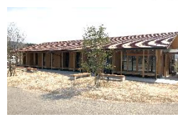
地域共生社会実現拠点 お試し住宅兼交流スペース えん処米や 賀野地域交流拠点施設