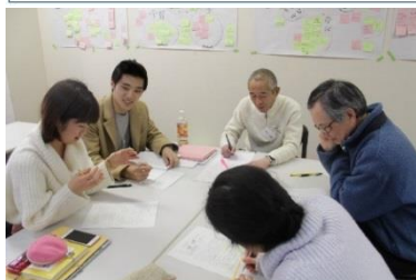
千葉大生と地域住民が共に学び合う生涯学習プログラム