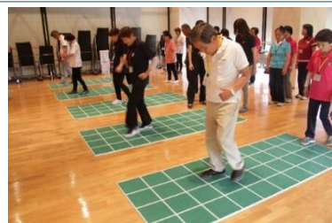
健康寿命延伸プログラムに基づく新たな運動教室