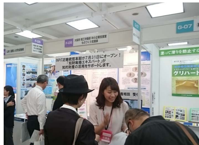
・大阪府ブースで「INPIT近畿統括本部」を紹介（大阪勤業展（H29.10））

◆広報・PR ○展示商談会への出展 ○「ものづくり補助金」「外国出願支援事業」採択企業にINPIT相談窓口リーフレットを配布（約1,400部）