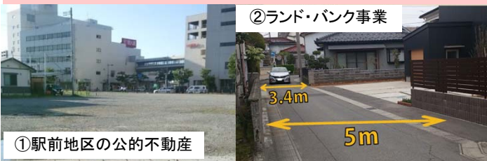
②ランド・バンク事業

NPO法人と連携し民間事業手法により、中心市街地の密集住宅地の空き家、空き地、狭あい道路問題を一体的に解決し、良好な住環境を整備し、まちなか居住を推進する。