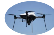
ドローン リモートセンシング