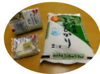
ローソンおにぎり