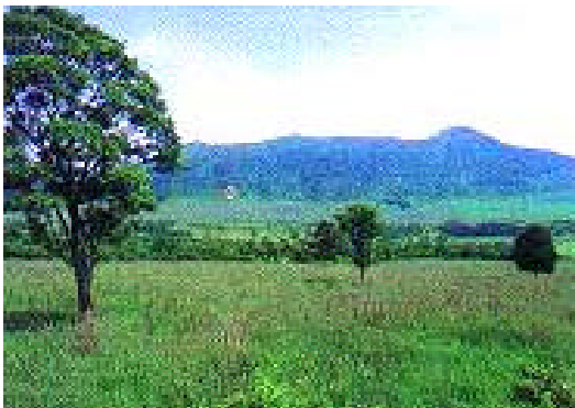
トレッキングに最適の田代高原