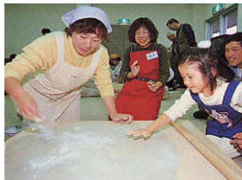
体験プログラム（そば打ち）