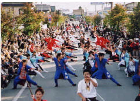
熱気の「むらやま徳内まつり」