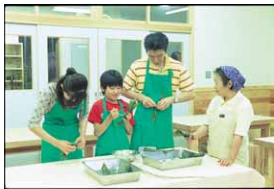
笹だんご作り体験