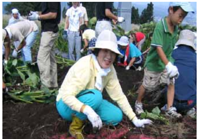
遊休農地を利用した畑で収穫を楽しむ市民