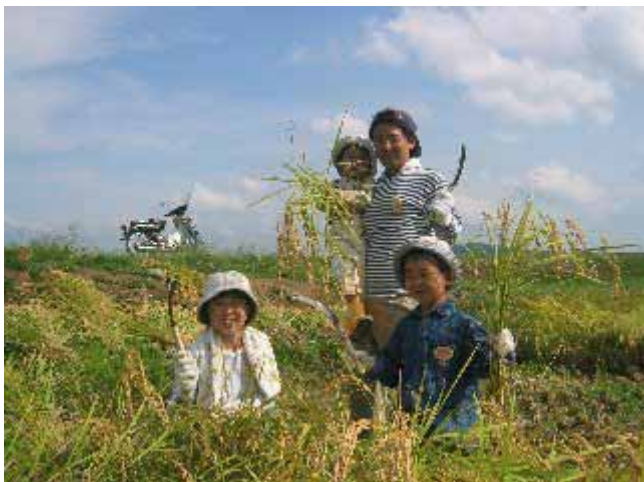
都会から来て稲刈りを楽しむ家族