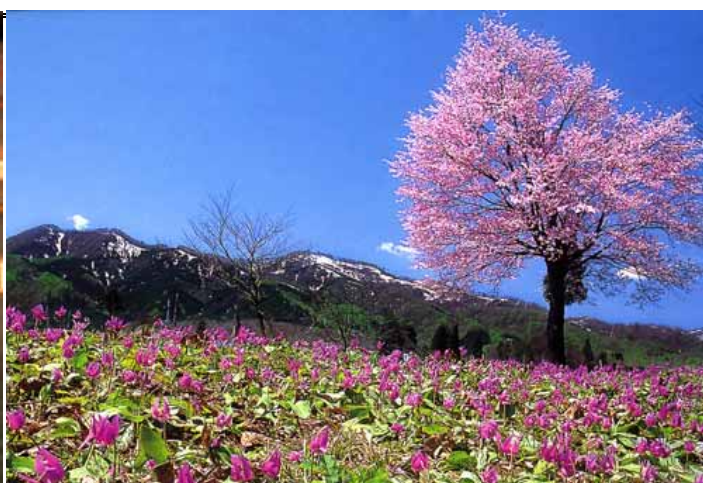
和賀山塊の麓のカタクリ群生地