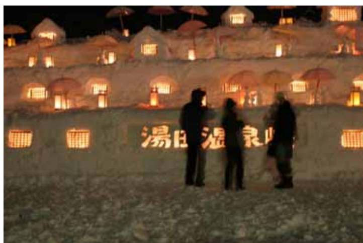
雪を楽しむイベント「雪あかり」