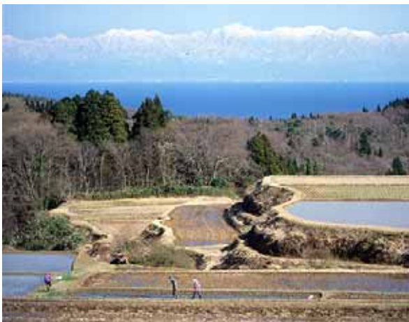
【棚田から見る海越しの立山連峰】