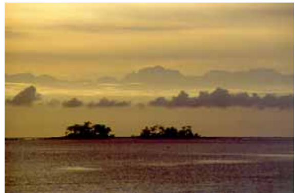
【朝焼けの海(蛇ヶ島と立山連峰)】