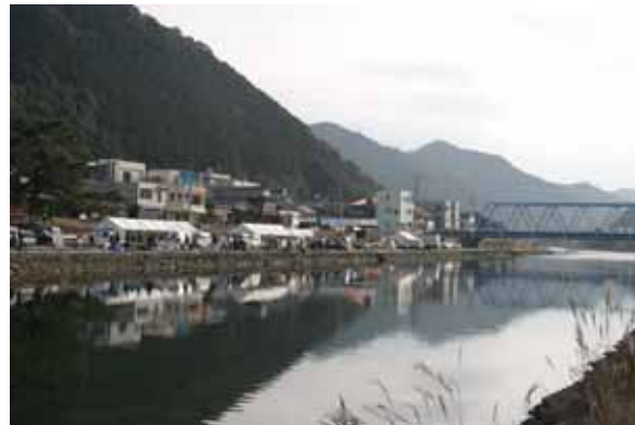
しらうおまつり岩松川