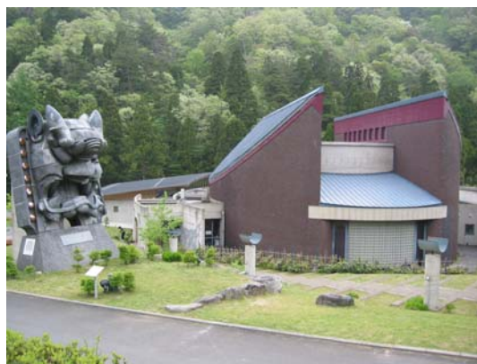
日本の鬼の交流博物館