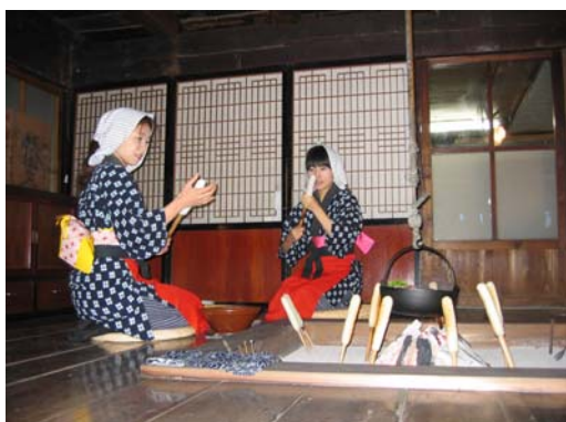
発祥地である名物「きりたんぽ」