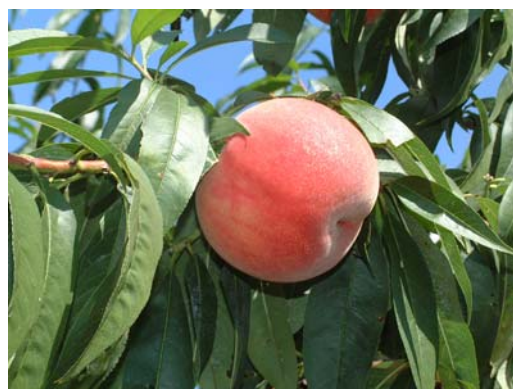
特産品「北限のもも」