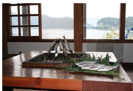
沼沢湖と特産ヒメマス