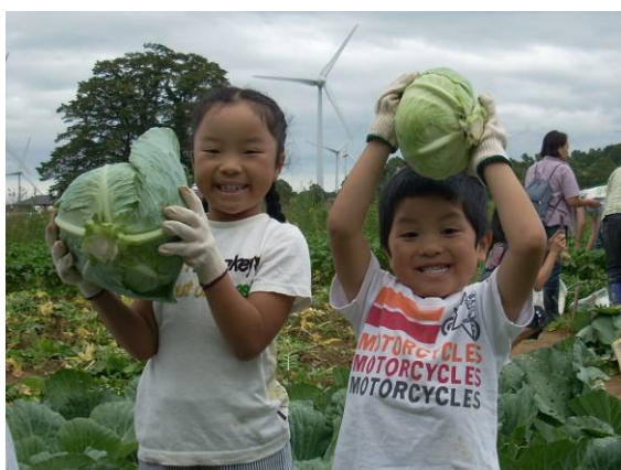
郡山布引“風の高原”での農業体験