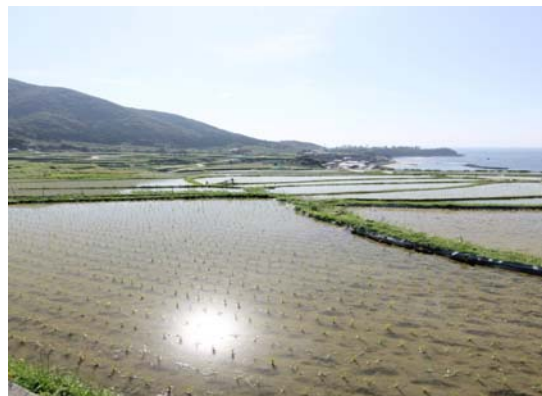
袖志の棚田（全国棚田百選）