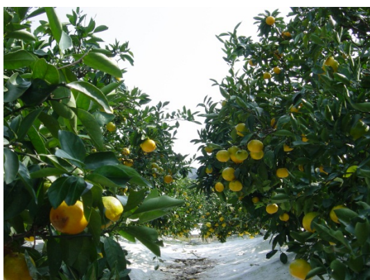
熊野市の特産品である柑橘類