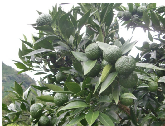
熊野市で生まれた香酸柑橘『新姫』