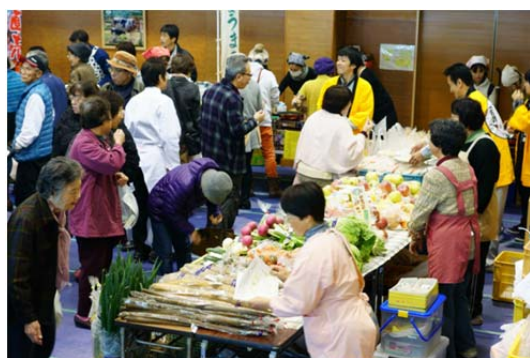
地産地消、地域活性化に向けた 農業者の取組