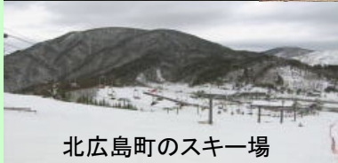
北広島町のスキー場