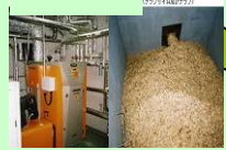
チップボイラー 木質チップ