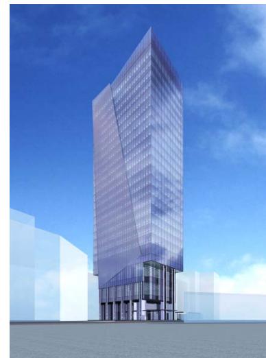
ビジネスと生活環境の一体的な整備