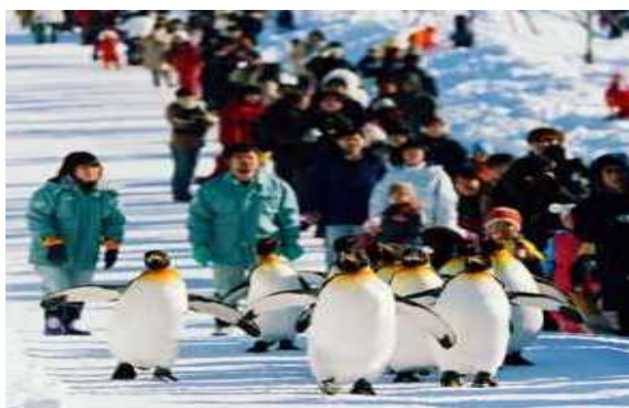
旭山動物園名物「ペンギンの散歩」