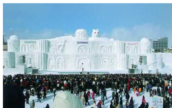
にぎわいを見せる旭川冬まつり