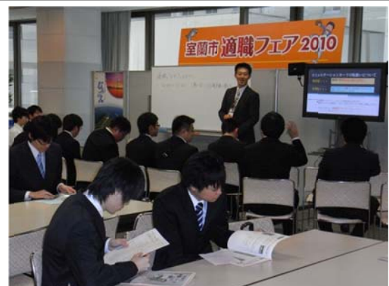
就職促進メニュー