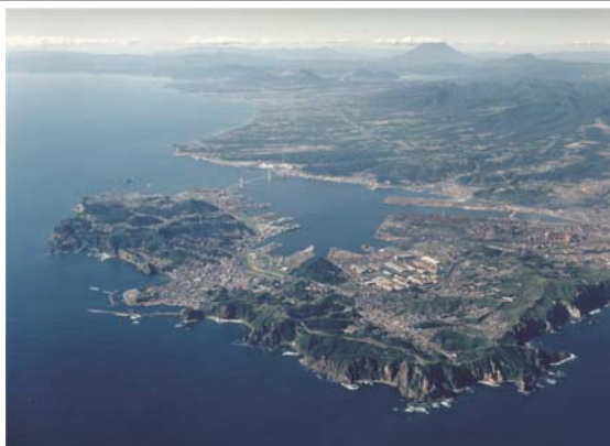
臨港部に工場群が集積する 「ものづくりのマチ」室蘭