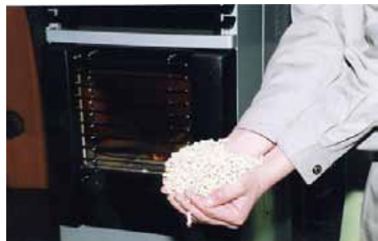
木質バイオマス資源の活用～木質ペレット燃料