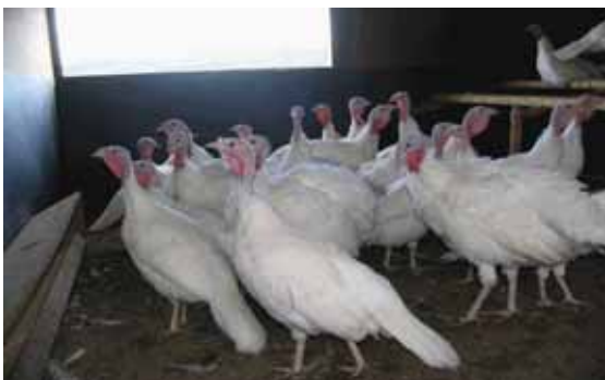
農畜産物の生産加工販売の促進～七面鳥