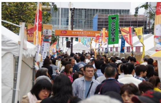
来場者で賑わう北の恵み 食べマルシェ会場