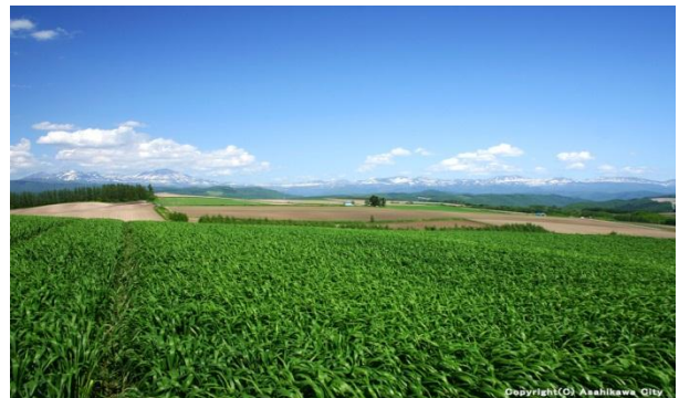
旭川市内の田園風景