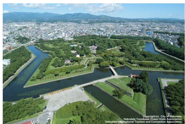
函館の代表的な観光地のひとつ 特別史跡五稜郭