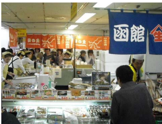
全国の物産展で人気の函館の水産食品販売風景