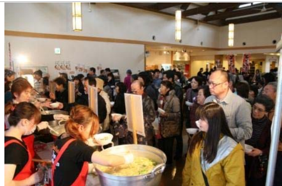
6種類の鍋を提供する冬季イベントの様子