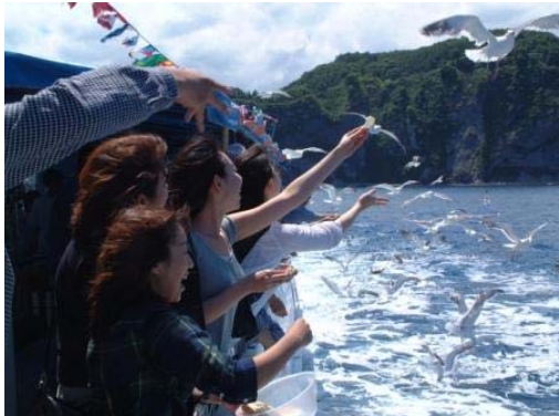
水中展望船でカモメとふれ合う観光客