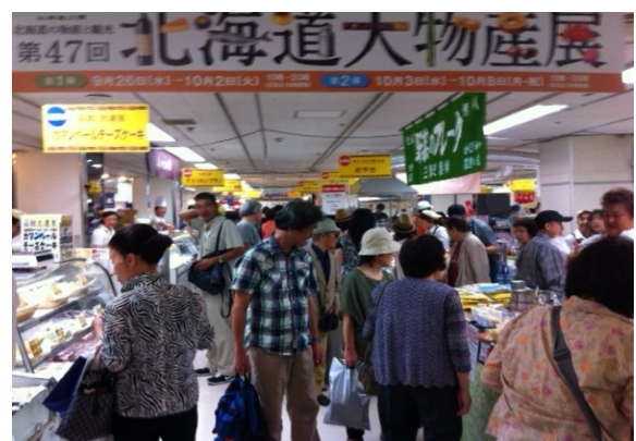
地域産品の取引拡大を目指す 「北海道の物産と観光展」