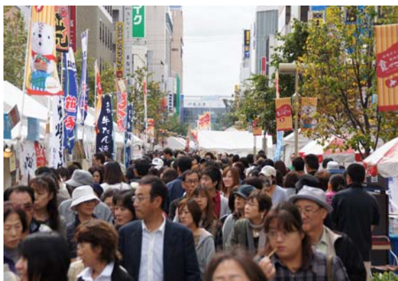
北海道最大級の食のイベント 「北の恵み 食べマルシェ」