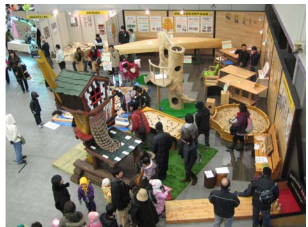
イベントにおける地域材 PR の様子