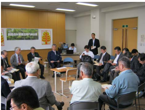
釧路森林資源活用円卓会議における議論