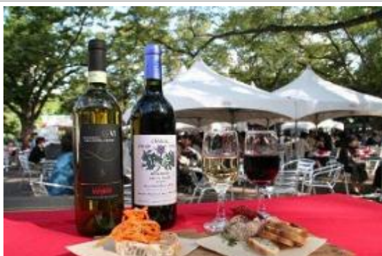
北海道の食を集めた 札幌オータムフェスト