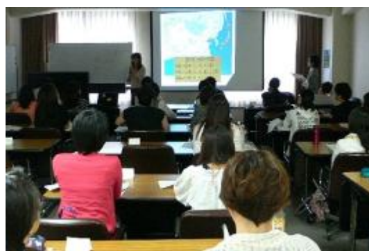
アジアからの観光客に対する おもてなしを学ぶ講座