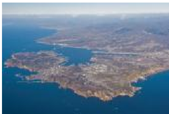
臨港地域に集積する工業群