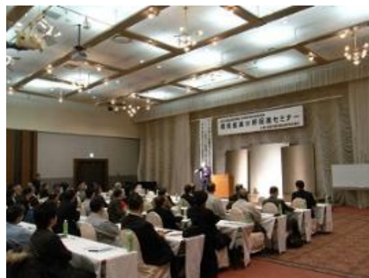
事業主向けセミナー