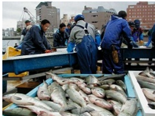
早朝魚河岸まち巡り (秋サケの水揚げ風景)