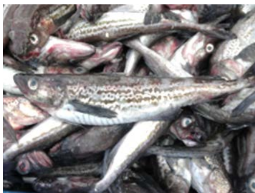
水揚げされたスケトウダラ