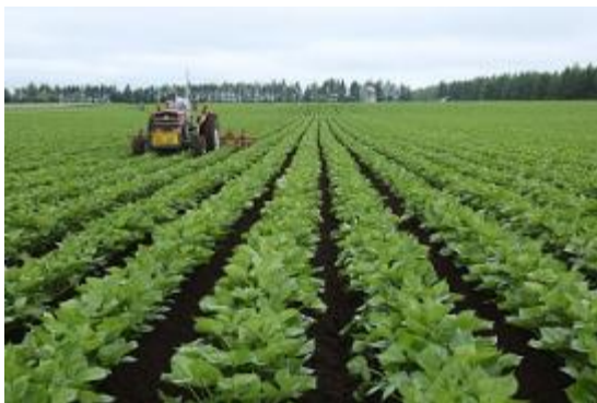
帯広市の農業を支える 広大な畑作農地