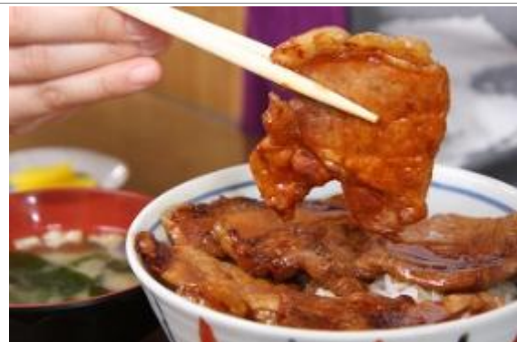
帯広市発祥の人気グルメ「豚丼」