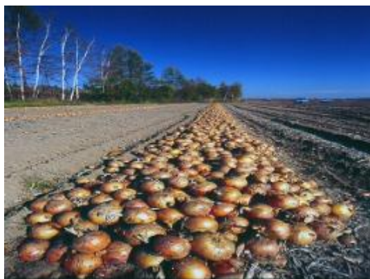
日本一の収穫量を誇る 北見市のたまねぎ