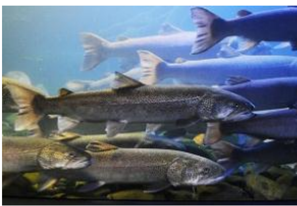
天然のイトウや珍しい淡水魚が 鑑賞できる「山の水族館」