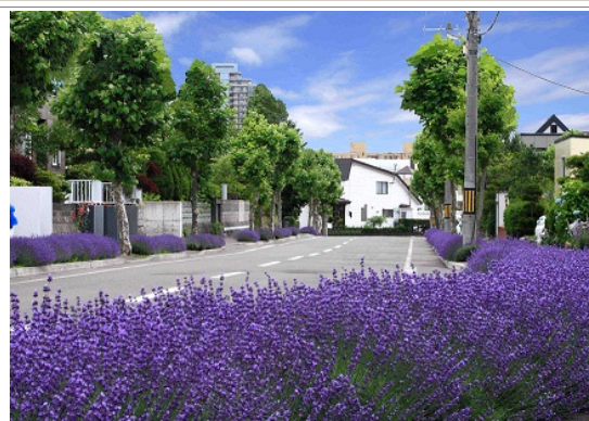
ラベンダーロード