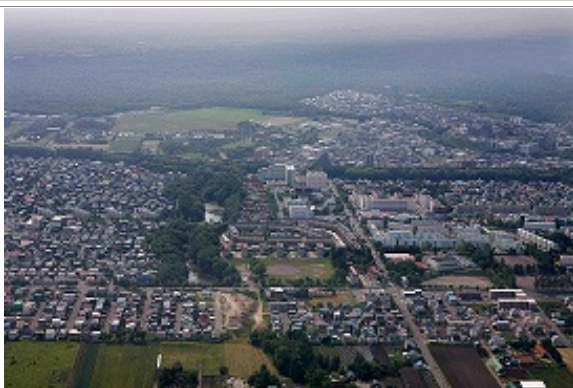
大麻地区（航空写真）