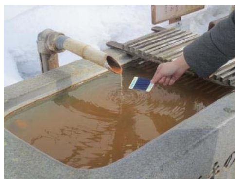
温泉水を活用した占い「ジオみくじ」