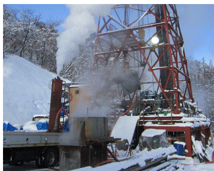
譲渡を受け高温地熱水の活用、 発電を行う地熱資源調査井