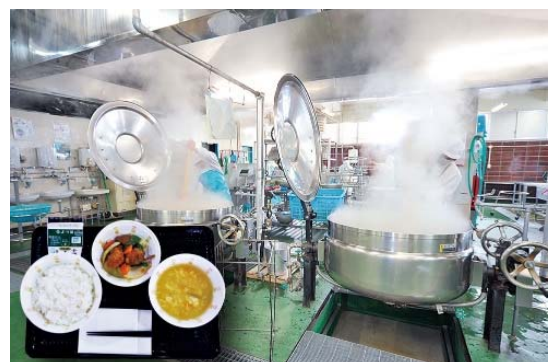
地域の食を支える複合的機能を持つ 給食センター