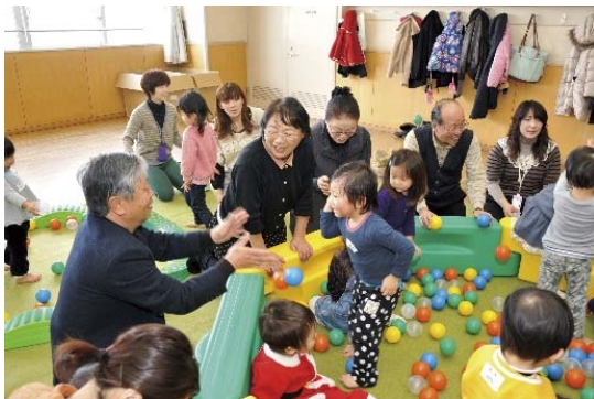
高齢者が生きがいを持って暮らせる 地域コミュニティ拠点

この少子高齢化社会を乗り越え、市民がいきがいを持って暮らしていけるよう、集積する医療機関・豊富で魅力ある食資源・陸路及び空路の交通の要所など本市の強みを生かした取組によって、“北のプラチナシティあさひかわ”を実現し、地域の活性化を図る。