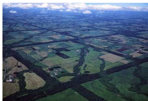
格子状防風林を守り育てる講座を開催し 林業人材を育成