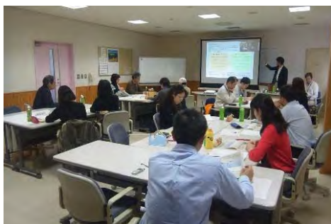
新規創業者向け商業・観光ビジネス講座 の開催