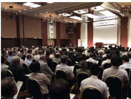
首都圏での立地セミナー