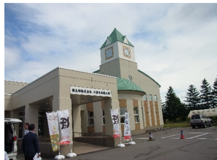
廃校を活用した資源型立地