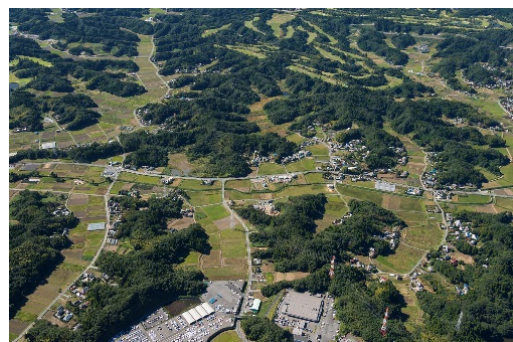
茂原にいはる工業団地