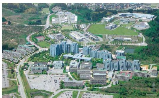
先端的研究開発拠点である いしかわサイエンスパーク